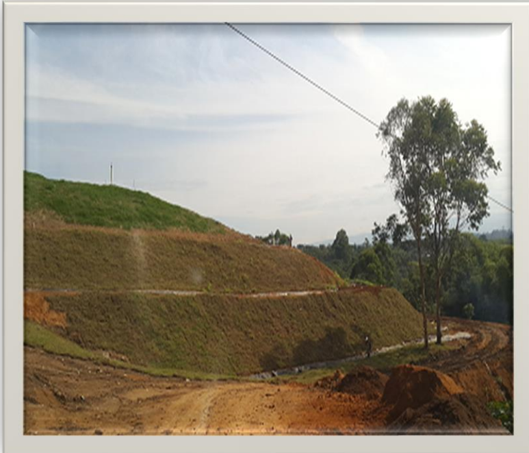
Obras para el cerramiento del Relleno Sanitario El Ojito, (Popayán Cauca).