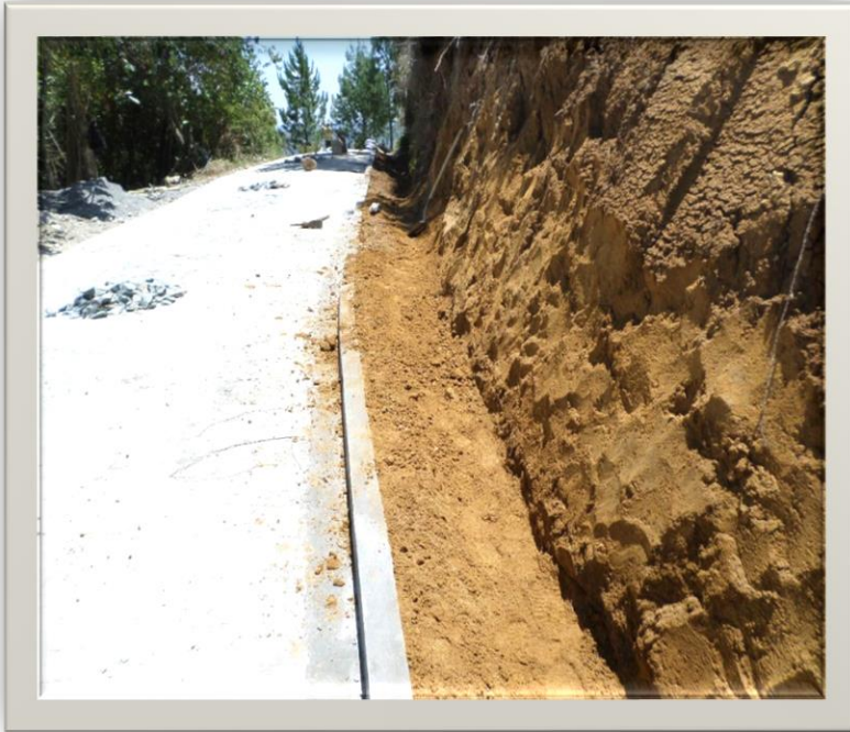
Construcción de placa huella y muros de contención, La Yunga, Popayán Cauca